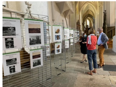
Ausstellung „Mayors for Peace“ im Dom