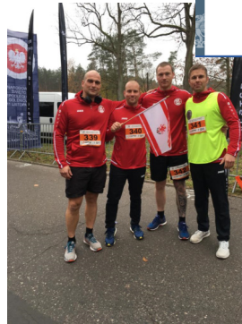
Sportliches Miteinander: Teilnahme am 14. Greifswalder Citylauf; Teilnahme am Unabhängigkeitslauf in Goleniów