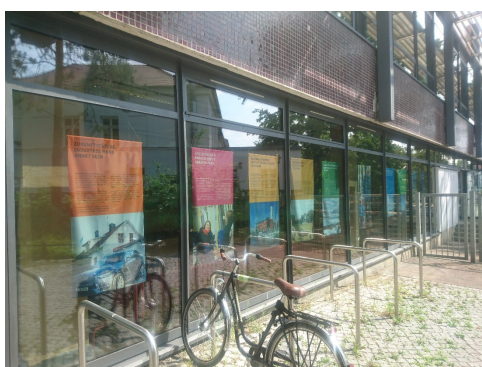
Ausstellung „Schweden und die Agenda 2030“ der Schwedischen Botschaft in der Mensa & Vortrag zu Greifswalds Nachhaltigkeitszielen