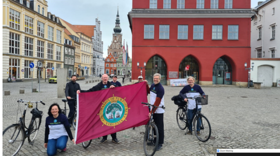
Newport News 1. US-amerikanische Stadt beim Stadtradeln; Förderung über Goethe Institut