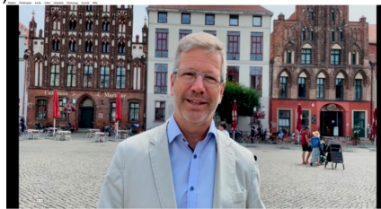
Grußwort anlässlich 41. Internat. Hansetage in Riga