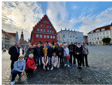
Interreg-Projekt mit Goleniów; diverse Treffen in Präsenz und digital: Zusammenarbeit Soziales, Kitas, Senioren