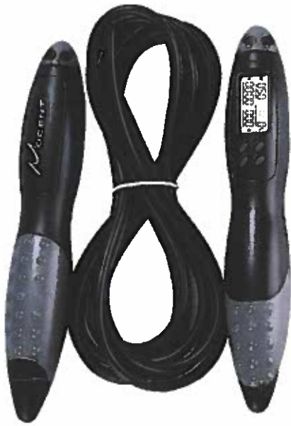
Mocent Springseil | 5 x 12,80€