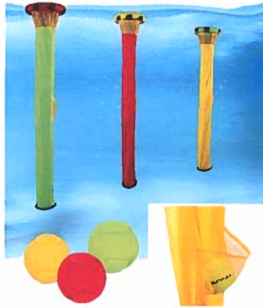
Tauchspiel Supertubes | 2x34.95€