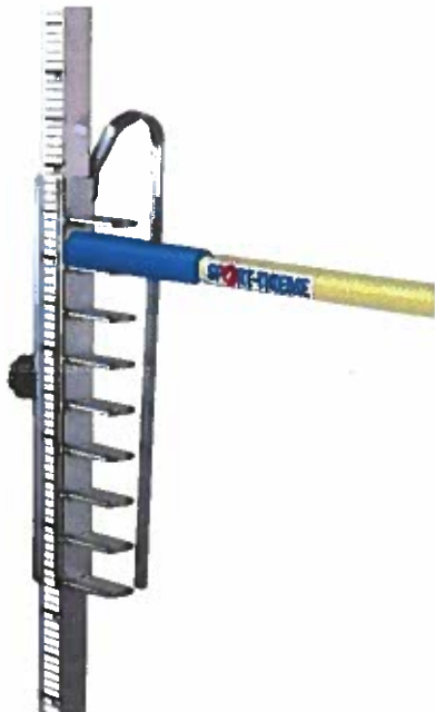
Lattenhalter (Paar) | 129,95€