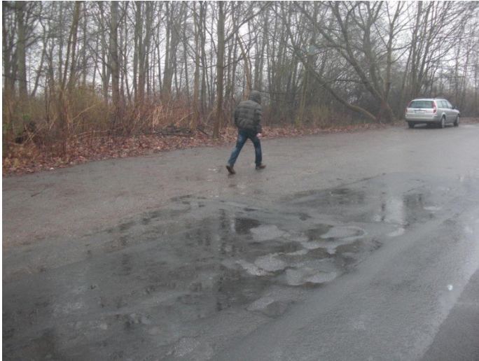
An der Wiek, befestigter Seitenstreifen (hellrote Fläche)