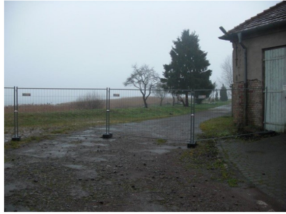
Stichstraße zum Hafen östlich des Gebäudes An der Wiek 5