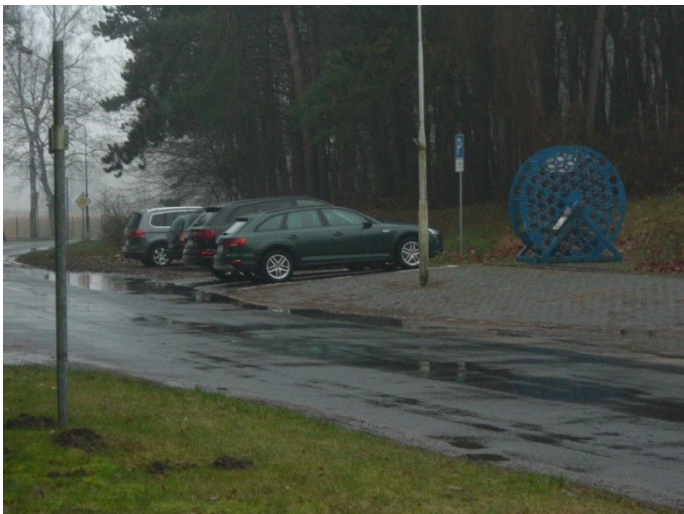
An der Wiek, ausgewiesene (reserviert) Stellplätze (grüne Fläche)