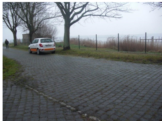
Stichstraße zum Hafen westlich des Gebäudes An der Wiek 5